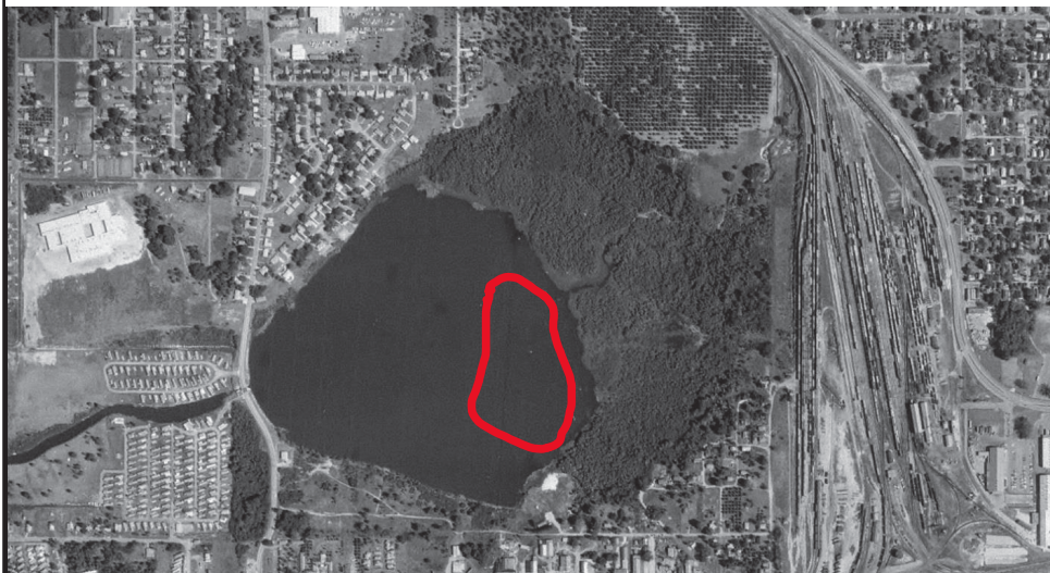
Figure C-3 - 1970 Aerial Photograph